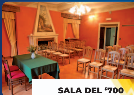
SALA DEL '700 57 mq, capienza 30 persone