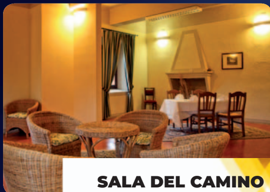
SALA DEL CAMINO 60 mq, capienza 40 persone