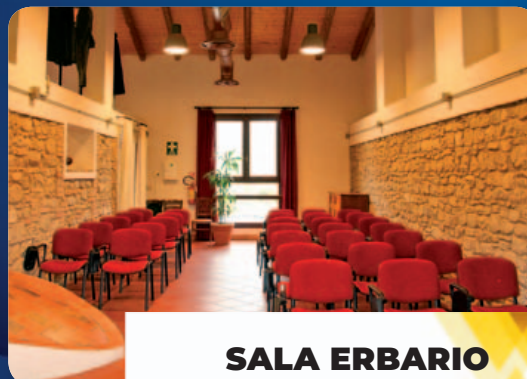
SALA ERBARIO 67 mq, capienza 34 persone