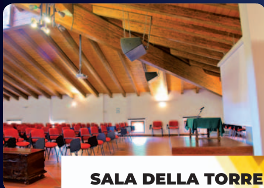
SALA DELLA TORRE 160 mq, capienza 180 persone

Le sale meeting del Villaggio della Salute Più dotate di tutti i servizi per le vostre riunioni aziendali (proiettori, lavagne, amplificazione, mixer digitale, possibilità di videoconferenze).